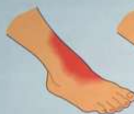
I степень Покраснение кожных покровов