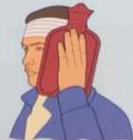
Грелкой с холодной водой (льдом) при ожогах III и IV степени (после наложения повязки!)