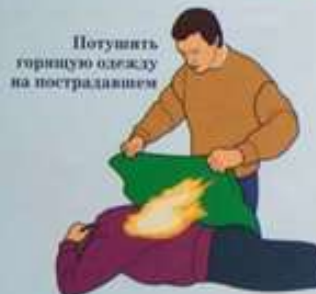
Потушить горящую одежду на пострадавшем

В ПЕРВУЮ ОЧЕРЕДЬ ПРЕКРАТИТЬ ВОЗДЕЙСТВИЕ ТЕПЛА ИЛИ ХИМИЧЕСКОГО ВЕЩЕСТВА