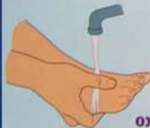
Струей холодной воды при ожогах I и II степени

На обожжённую часть тела наложить асептическую повязку