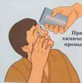
При попадании химического вещества промыть глаза водой

На обожжённую часть тела наложить асептическую повязку