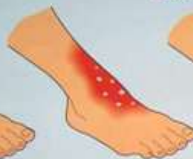
II степень Образование пузырей на коже