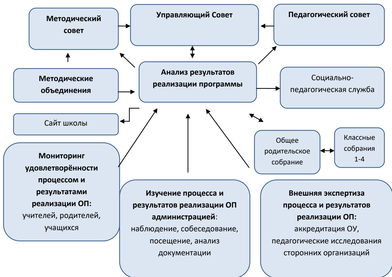
Схема показывает механизм обеспечения общественного участия и учета интересов, потребностей участников образовательного процесса при разработке и реализации образовательной программы.